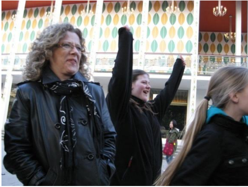
En alle tiders aften i tivoli....

tur i Tivoli. Tak til de mange familier, der indlogerede pigerne i København.