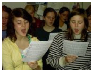
Er man på.....eller hvad?!!